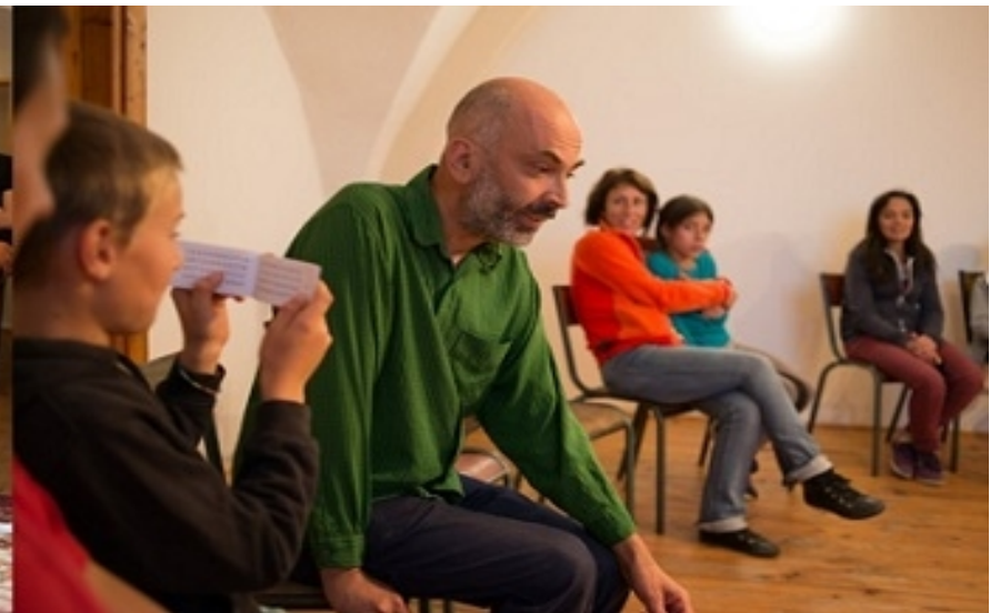
3 Petites Fugues mathématiques / Théâtre, Magie et Mathématiques Chiendent - Théâtre / Création 2019